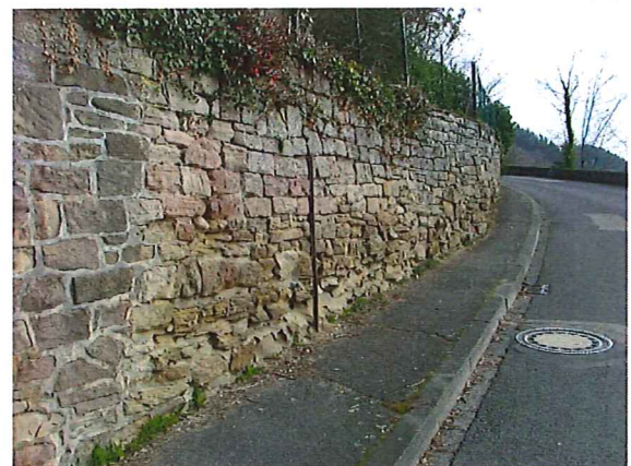
UNTERE STEINLAGE VERWITTERT ZERFALLEN

[9] S=1, V=0, D=3 EP BSP-ID 136-06 Stützwand, massiv, Mauerwerksstein, Bereichsweise, Zerfallen, Fläche: 20,00 m2, Unten, Maßnahme {1}