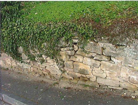
STEINE IM VERBAND GELOCKERT

[14] S=3, V=1, D=3 EP BSP-ID 136-05 Stützwand, massiv, Mauerwerksverband, Bereichsweise, Locker / lose, Fläche: 2,00 m2, Mauerwerk ausgebaucht Steine lose und herausgedrückt, Maßnahme {1}