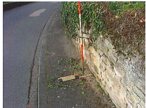
BIS 20 CM HERAUSGEDRÜCKT

[15] S=3, V=1, D=3 EP BSP-ID 136-05 Stützwand, massiv, Tragendes Mauerwerk, Stellenweise, Herausgedrückt, bis zu 20 cm, Maßnahme {1}